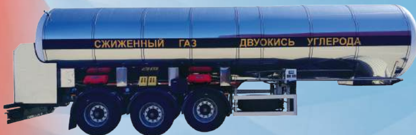
Полуприцеп для перевозки CO2. Оборудован насосом.