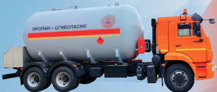
Автоцистерна на шасси КамАЗ