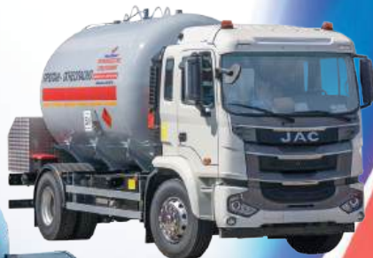
Автоцистерна на шасси JAC

Автомобили оборудованы в соответствии с требованиями ДОПОГ.