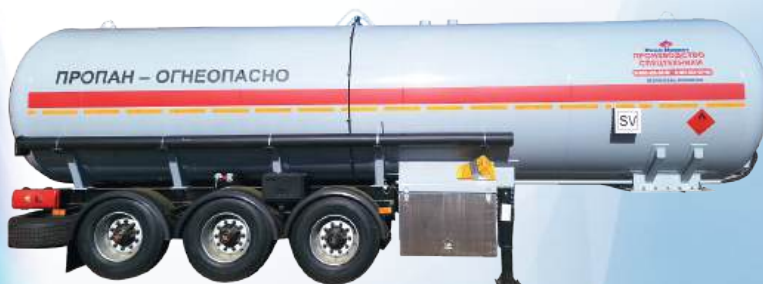
Полуприцеп для перевозки СУГ. Оборудован насосом и счётчиком.